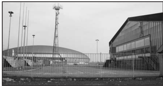
PALAGEORGE: sarebbe in corso una trattativa dell'ultimo minuto con la "Pallavolo Verona" per "riaccendere il Palageorge", che sembra ormai ridotto ad una specie di ripiego delle beghe altrui.

Molti si chiedono se allo stato attuale, visto anche il co-