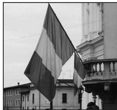
Il tricolore "scomparso".

Sicuramente ai familiari sarà venuta l'idea di controllare la registrazione delle telecamere, installate dal Comune, che si trovavano in evidenza sulla facciata del fabbricato di fronte; se erano in funzione, sicuramente avranno ripreso le