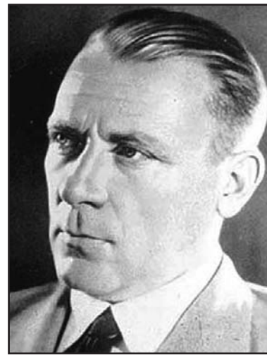
Lo scrittore russo Michail A. Bulgakov, 1891-1940.

Nel «vagabondo filosofo Yeshua», un utopista per il quale tutti gli uomini sono buoni, il procuratore non riconosce alcun crimine. Non vorrebbe perciò condannarlo, ma per la ragion di stato e per la sua intima viltà di fronte al sommo sacerdote Caifa, per paura di cadere in disgrazia presso l'imperatore Tiberio, lascia che venga giusti-