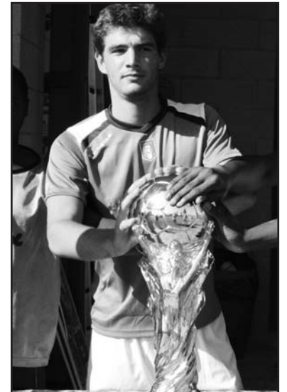
Le mani sulla "coppa del mondo".

La cerimonia, si terrà sabato 4 settembre alle ore 15, che coincide con l'inizio del torneo che vedrà impegnata la "nazionale italiana" contro diverse formazioni di giocatori provenienti da diversi nazionalità. Le varie fasi del torneo si svolgeranno per tutto il mese di